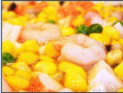
yù mǐ xiā rén 玉米虾仁