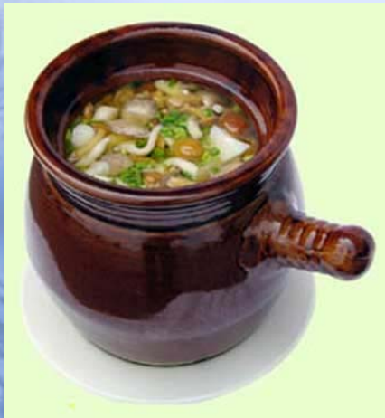
jūn tāng 菌汤