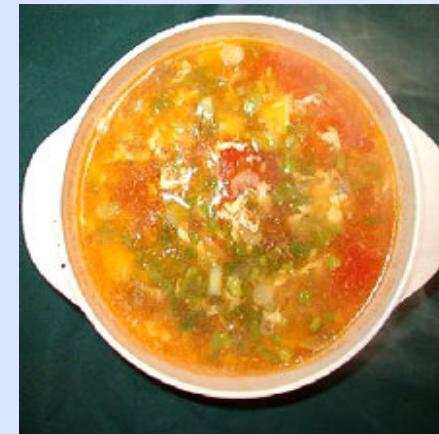
Xī Hóng Shì Dàn Tāng 西红柿蛋汤