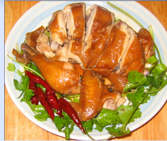
Běi Jīng Kǎo Yā 北京烤鸭