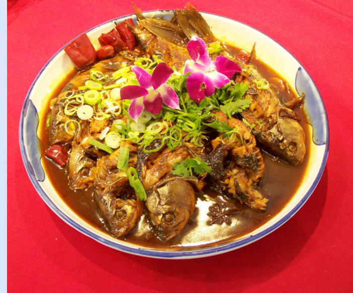
hóng shāo jì yú 红烧鲫鱼