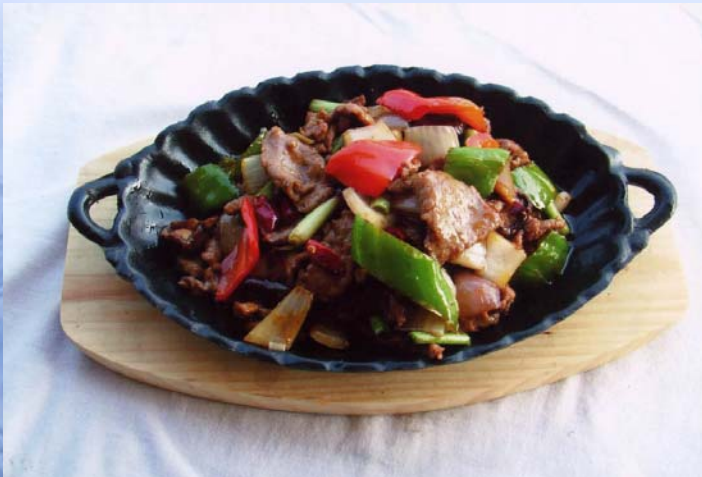
Tiě Bǎn Niú Ròu 铁板牛肉