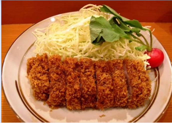
Zhà Zhū Pái 炸猪排