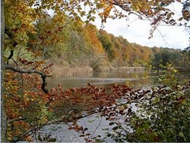
秋天qiū tiān autunno