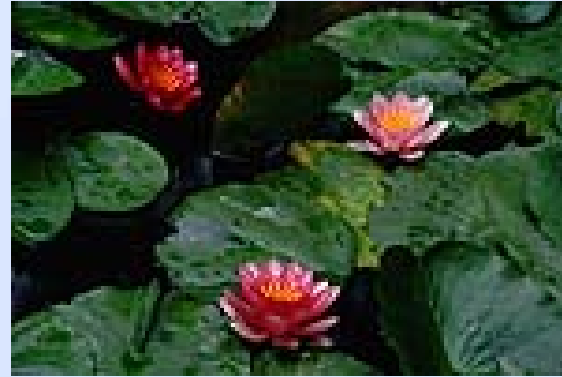
夏天 xià tiān estate