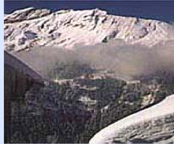
冬天dōng tiān inverno