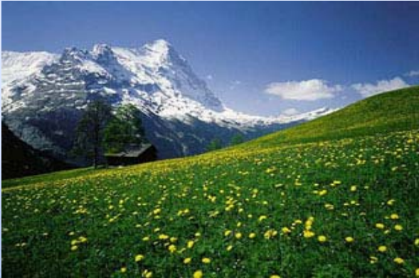
春天 chūn tiān primavera